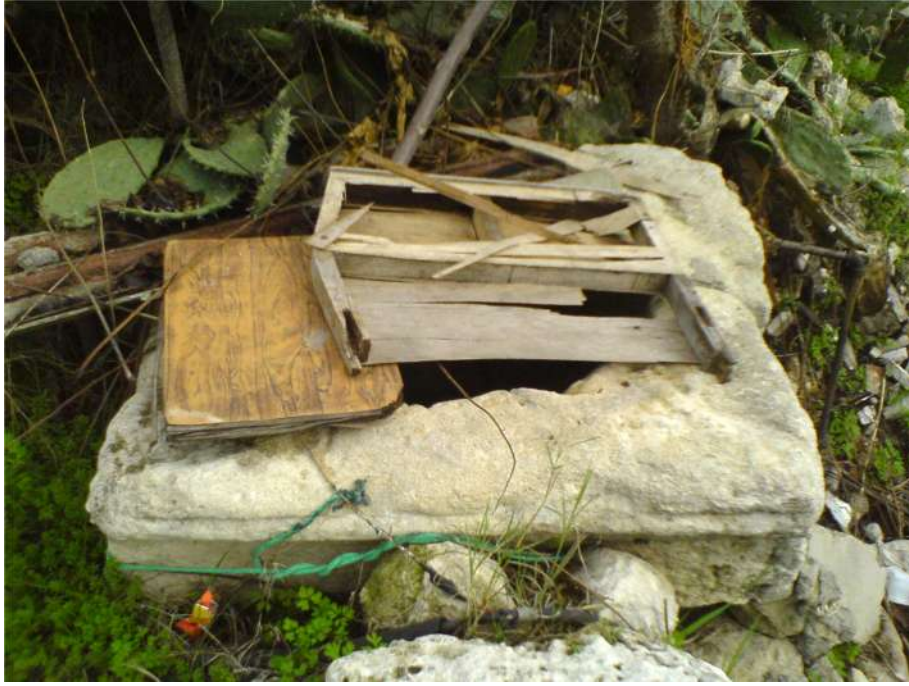
صورة ١ - البئر الأثري الذي يقع بين المقبرة الأرثوذكسية والتلة