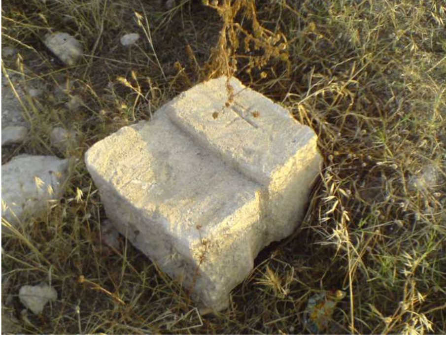
صورة ٥ - حجر يشكل جزء من عقد كبير محفور عليه صليب بطريقة غير محكمة يقع فوق التلة