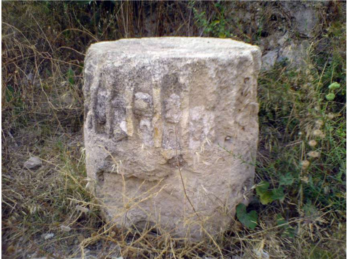
صورة ٦ - قاعدة عمود أسطوانية بديعة تقع عند سفح التلة حين تصويرها