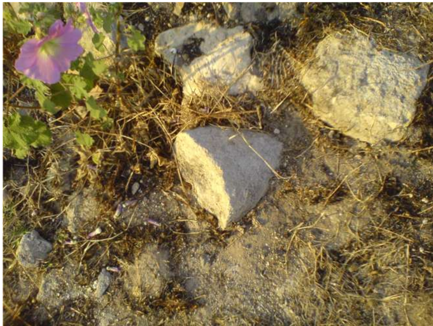
صورة ٤ - بقايا عمود أسطواني صغير يقع بين الأتربة فوق التلة