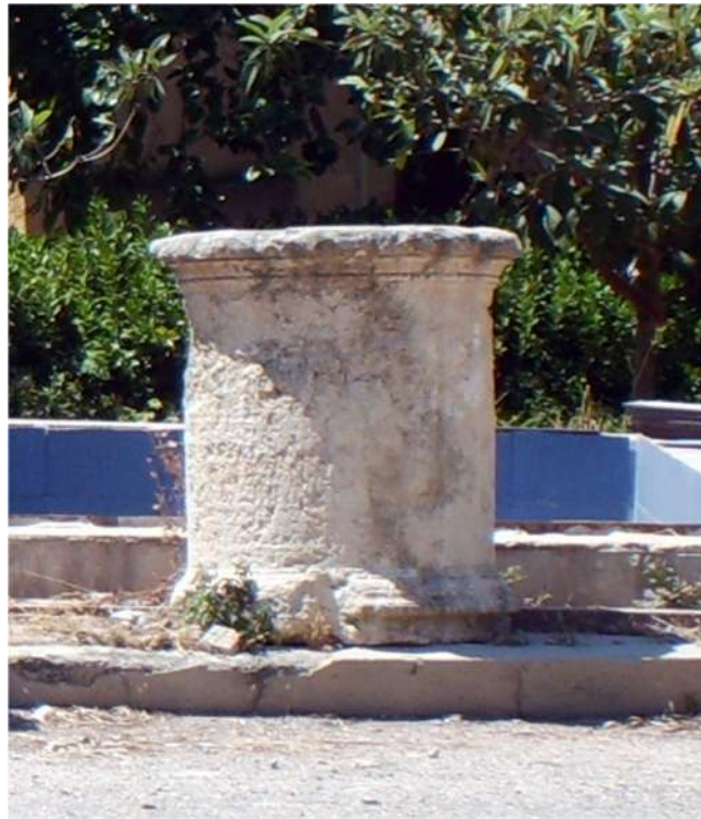
صورة ١٠ - حجر محفور بطريقة بدیعة یظهر أنه كان جزءاً من بناء عظیم، معروض حالياً ضمن مقر الدفاع المدني المجاور للتلة