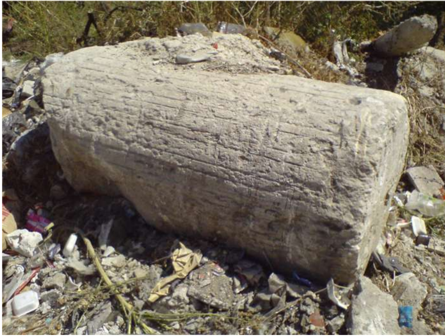
صورة ٨ - جزء من عمود أسطواني ضخم ملقى بجانب كراج السرافيس المجاور للتلة