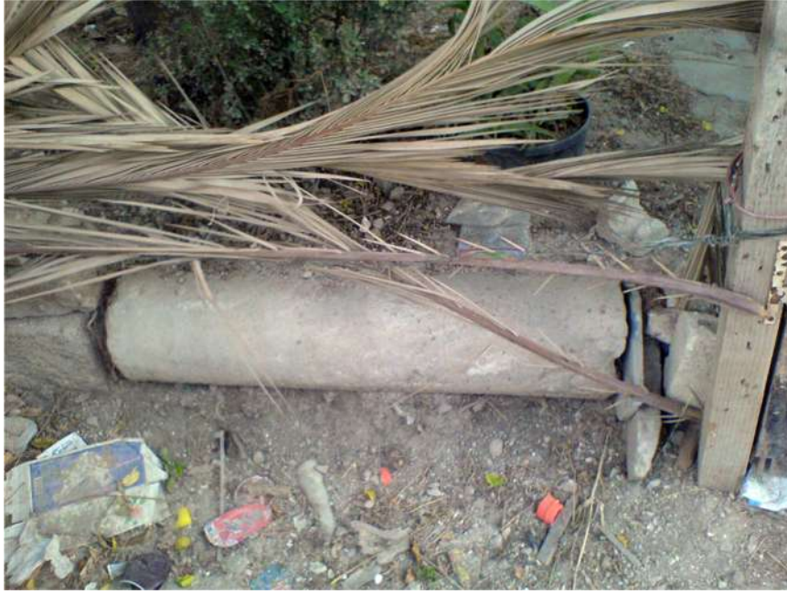
صورة ٧ - عمود أسطواني صغير مستخدم في سور لأحد الحقول الصغيرة على حدود للتلة