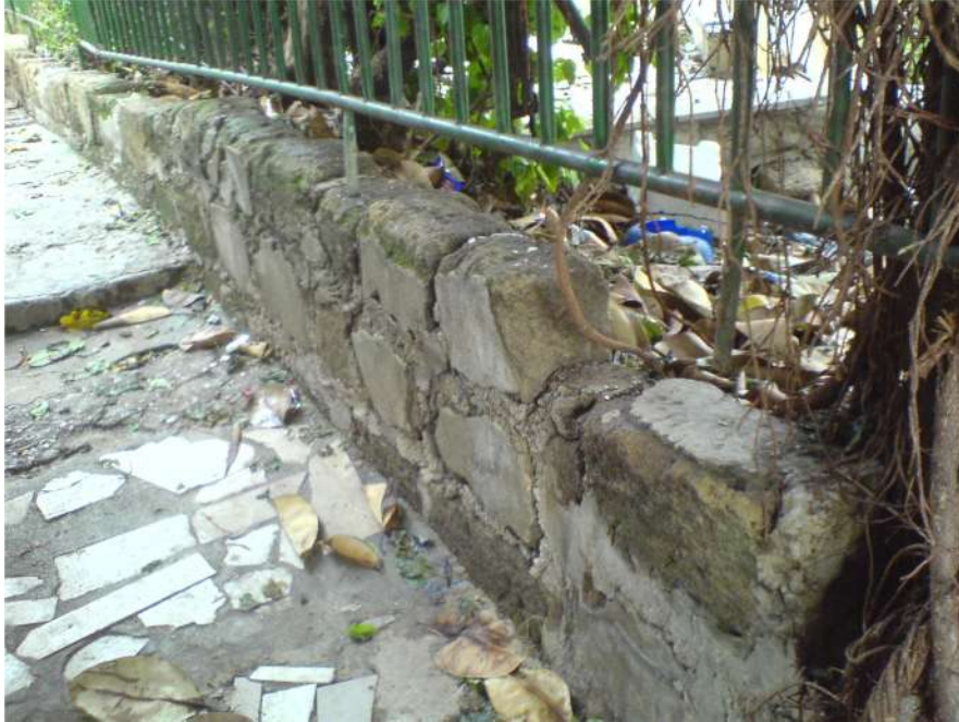
صورة ٢ - الحائط القديم الذي يقع في الجهة الشرقية من الحدود المفترضة للدير وهو مستقيم تماماً