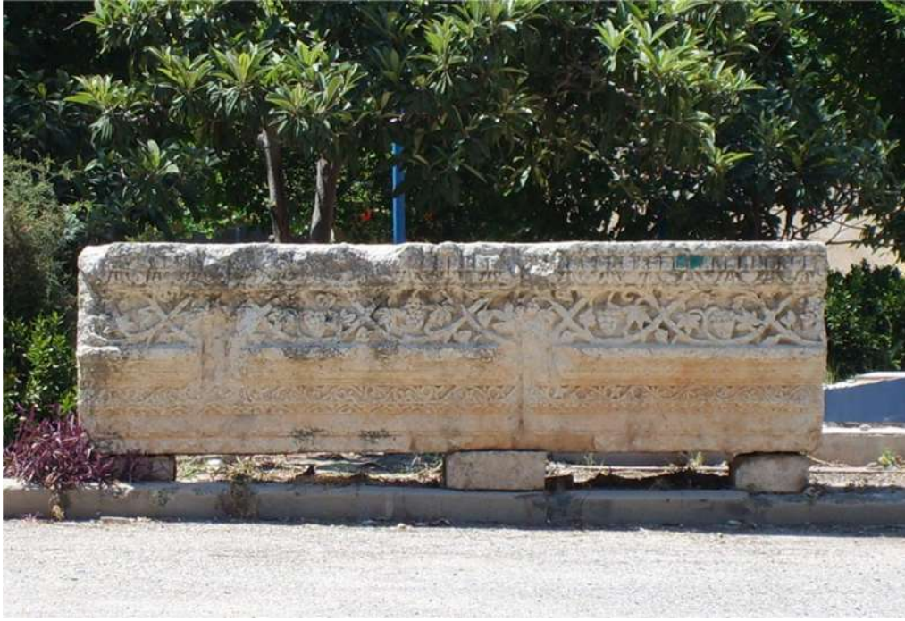
صورة ٩ - حجر محفور بطريقة بدیعة مزین بأغصان وعناقید الكرمة یظهر أنه كان جزءاً من بناء عظیم، معروض حالياً ضمن مقر الدفاع المدني بین التلة والمقبرة الأرثوذكسیة