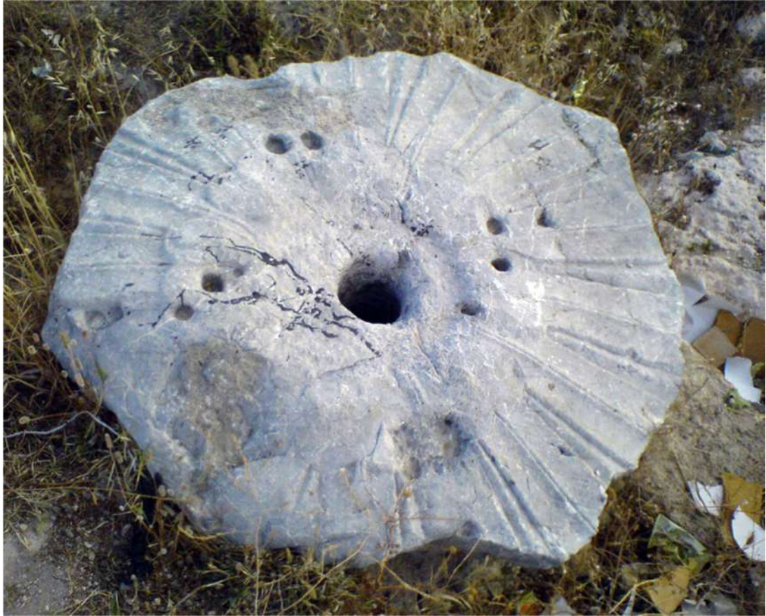
صورة ٣ - حجر كبير قطره حوالي المترين قد يكون استعمل وقتاً ما حجرَ رحي محفور بطريقة بدیعة على شكل زهرة