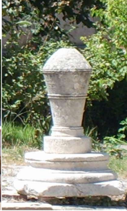
صورة ١١ - آثار مختلفة معروضة حالياً ضمن مقر الدفاع المدني المجاور للتلة